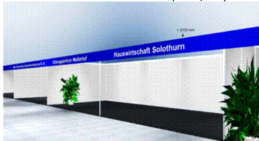
Stand mit Seitenwänden (Beispiel)