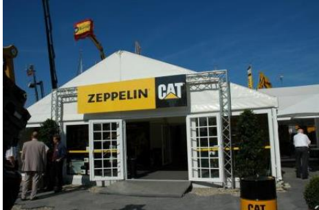
Stand freistehend (Beispiel typenähnlich)